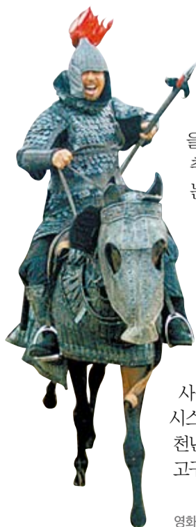
영화 <안시성> 스틸컷

고구려 벽화는 초기에 풍속화가 많고, 후기로 갈수록 종교적인 그림이 많아진다. 황해도 안악3호분(357년)에는 부역, 차고, 우물의 모습과 묘주를 호위하는 <대행렬도>가 그려져 있다. 이 그림을 통해 광대한 영토를 관리하는 데 바탕이 되는 토목, 야금, 기계 등 공학기술이 발달했다는 것을 유추할 수 있다.