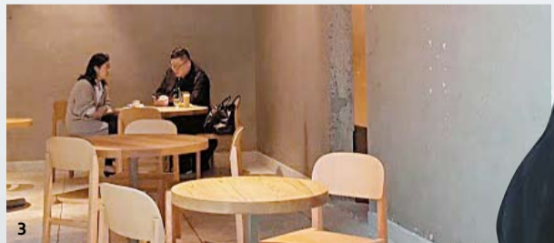
1 벨라 도노반 원두로 내린 드립커피를 들고 있는 블루보틀 창업자 제임스 프리먼. 2 드립 커피를 만들고 있는 바리스타들. 맛있는 커피를 만들기 위해 드리퍼를 MIT와 공동 제작했다. 3 블루보틀엔 노트북을 갖을 수 있는 전기 콘센트와 커피 와이파이조차 연결되지 않는다.