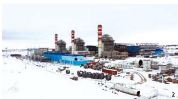
1 이집트 카이로 전경. 2 현대건설이 시공한 알제리 아인 아르나트 1200MW 복합화력발전소. 3 이집트 카이로에 위치한 포시즌 호텔 나일 플라자 역시 현대건설이 지었다.

지중해를 사이에 두고 유럽과 마주한 알제리는 아프리카 7개국과 접경하는 불어권 국가의 중심지다. 원유(세계 16위), 가스(세계 10위), 셰일가스(세계 3위)를 다량 보유해 에너지 대국으로도 불린다. 그러나 노후화된 설비와 성숙기에 접어든 유전, 외국인 투자 부족으로 에너지 산업 발전이 어려운 상황이다. 이에 알제리 정부는 석유·가스 산업 효율화와 국가 경쟁력 강화를 위해 법 개정을 통한 외국자본 유치를 적극 모색하고 있다. 개정안의 주요 내용은 ▶생산 분배 시스템(자본과 기술을 투자하고 계약에 따라 수익을 가져감) ▶파트너 권한을 보장하는 참여계약 시스템(비용투자, 이익배분, 세금 납부 등 알제리 국영기관과 같은 의무와 권리를 가짐) ▶리스크 서비스 계약 도입(개발 성과에 따라 리스크를 보상받음) 등이다. 현재 불안한 정치 상황과 맞물려 법 개정이 미뤄지고 있으나, 알제리 경제에서 석유·가스 자원이 차지하는 비중을 감안할 때 머지않아 통과될 것으로 보인다. 발전부문도 전망이 밝다. 알제리는 2만1000MW 규모의 발전설비 용량을 갖추고 있으나, 설비가 노후화돼 있다. 알제리 정부는 우마세(Oumache-III) 복합화력발전소를 포함한 Mega deal