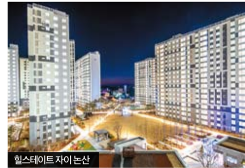
힐스테이트 자이 논산

건강한 생활 공간 힐스테이트 자이 논산 주거 선호도 높은 지역에 자리한 논산 최초의 1군 브랜드 아파트, 힐스테이트 자이 논산. 교통·상업·교육 인프라는 물론 자연에 둘러싸인 쾌적함까지 모두 갖춘 프리미엄 단지다. 최첨단 사물인터넷(IoT) 기술을 적용해 스마트폰 하나로 공동현관문 개폐 등의 아파트 시설을 이용할 수 있어 만족도 높은 삶을 영위할 수 있다.