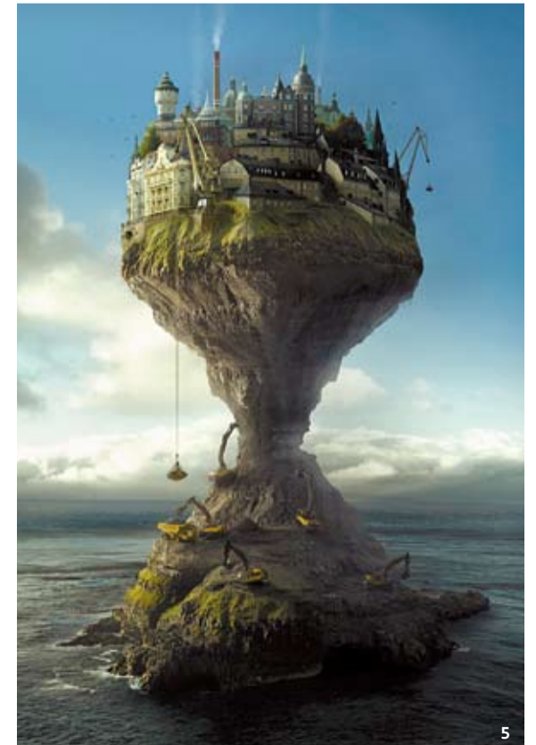
1 Full Moon Service (2017), 2 Impact (2016), 3 Self-supporting (2017), 4 Fishy Island (2009), 5 Demand & Supply (2017).